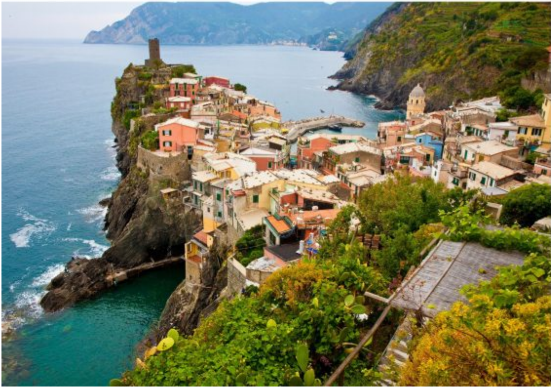
séjour randonnée 3 jours